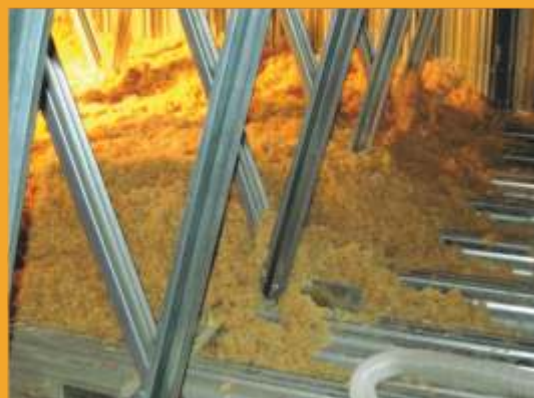
УТЕПЛЕНИЕ ЧЕРДАЧНЫХ ПОМЕЩЕНИЙ